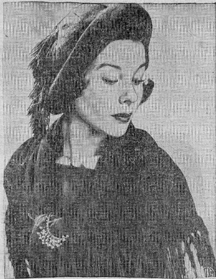
REBOZO PARA EL OTOÑO — Creando algo nuevo en la moda. Legroux exhibió una colección de juegos de sombreros y rebazos en su tienda de Nueva York. Este es uno de ellos.