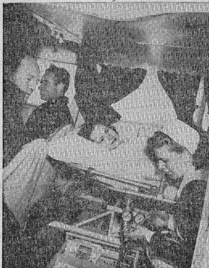
Vista del interior de una ambulancia aérea lista para alzar el vuelo. El paciente y la enfermera están en la cabina del avión y a la izquierda se ve al piloto y copiloto. Este servicio de ambulancias aéreas acaba de iniciarse en los Estados Unidos.

PARIS, 20 UP — La mina Laboradee cerca de Saint Etienne se inundó junto con otras cinco cerca de Albi. En Carmaux hubo escaramuzas entre las fuerzas del gobierno y 1.500 huelguistas que arrojaron de piedras y éstas se apoyaron de la central eléctrica, cortando la electricidad con bombas y causando la inmediata inundación en las minas. La única alteración del orden en la zona